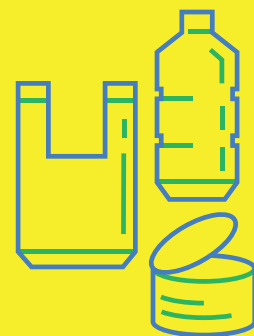
Plastikas ir metalas